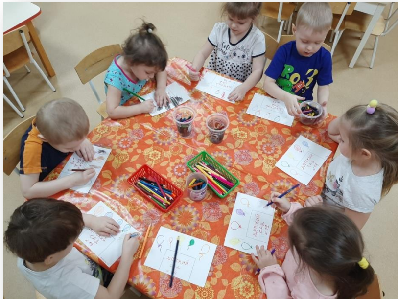
Рисунок на тему «Поздравляем детский сад»