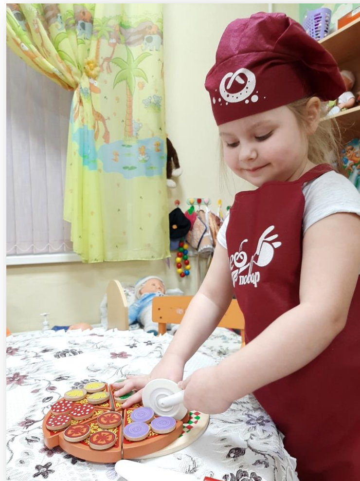
Сюжетно-ролевая игра «Повар»